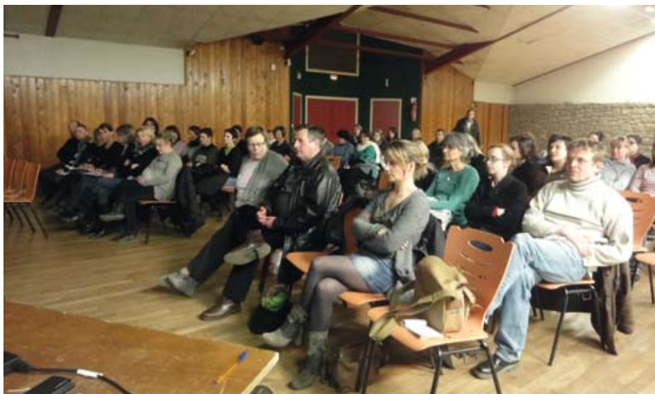
Réunion publique de présentation de l'application de la réforme du 26 mars.