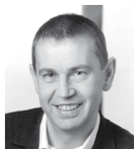
Directeur de la publication : Loïc Raoult