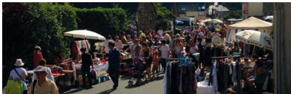
Grand soleil pour le vide-greniers de Plourh'anim dimanche 14 juillet