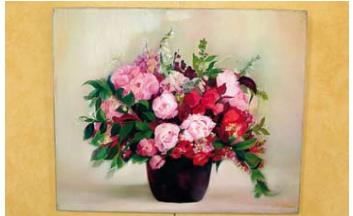
Sabrina Renaud expose ses toiles à la mairie de mi-juillet à mi-août.