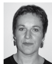
Rédaction : Anne Le Tilly